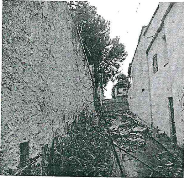
1. Vista externa do muro – queda parcial/lateral.