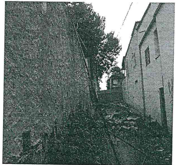
4. Vista externa do muro – extensão da área interdita.